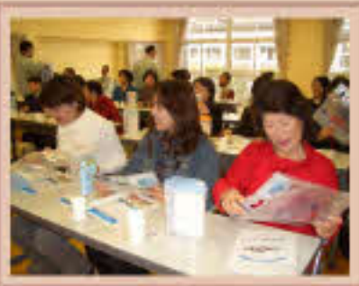
災害用応急給水袋を手にして