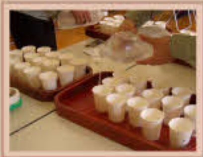
市販の水との飲み比べ