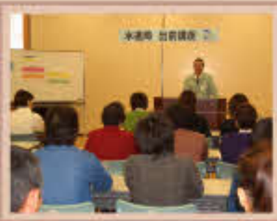
身近な水道水。でも、意外と知らないことも