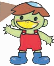
佐賀市上下水道局 マスコットキャラクター さがつば 潤くん

対象地区 公共下水道・農業集落排水（含予定）区域以外の佐賀市全域 工事 本体工事は、上下水道局が実施します。 個人負担 トイレの改造や排水設備工事、単独処理浄化槽の廃止等は個人負担となります。個人負担分については、排水設備指定工事店から見積りをお取り下さい。